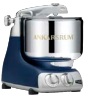
AKM6230 RB Royal Blue Matt