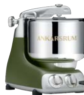
AKM6230 OG Olive Green Matt