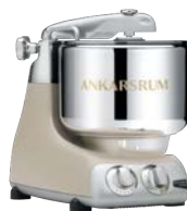
AKM6230 HB Harmony Beige Matt