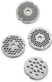
Edelstahl Lochscheiben 2,5 / 4,5 / 6 / 8 mm.