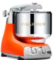
AKM6230 PO Pure Orange Hochglanz