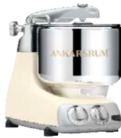
AKM6230 LC Light Crème Hochglanz