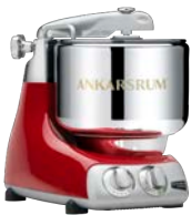
AKM6230 R Red Hochglanz Metallic