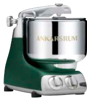
AKM6230 FG Forest Green Matt