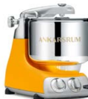
AKM6230 SB Sunbeam Yellow Matt