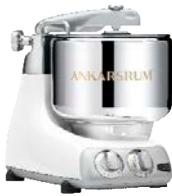
AKM6230 GW Glossy White Hochglanz Metallic