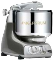
AKM6230 BC Black Chrome Hochglanz Metallic