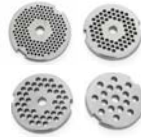
Lochscheiben 2,5 / 4,5 / 6 / 8 mm Ⓢ