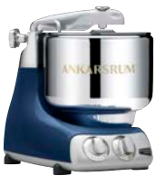
AKM6230 OB Ocean Blue Hochglanz Metallic