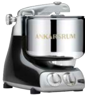
AKM6230 BD Black Diamond Hochglanz Metallic