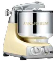
AKM6230 C Crème Hochglanz