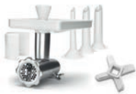
Fleischwolf Basispaket (Messers & Würstfüllsätze, 10 / 20 / 25 mm) Ⓢ