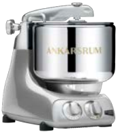
AKM6230 JS Jubilee Silver Hochglanz Metallic