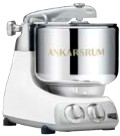
AKM6230 MW Mineral White Matt