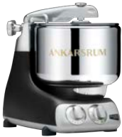
AKM6230 B Black Matt